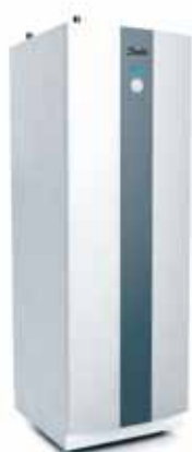
DHP-AQ MAXI Indedel

En DHP-AQ luft/vand varmepumpe er en nem og uproblematisk mulighed for at opnå store energibesparelser og større komfort. Startinvesteringen har en typisk tilbagebetalingstid på ca. syv år, hvilket giver dig mange år med fortsatte besparelser.